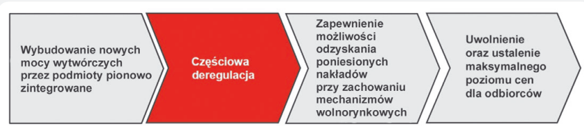
Rys. 1. Kierunki deregulacji rynku energii elektrycznej w USA